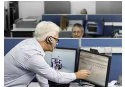
Fernservice: Hohe Maschinenverfügbarkeit durch kürzere Stillstandzeiten und damit niedrigere Produktionskosten.