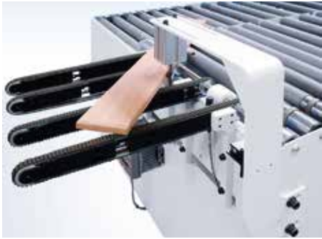
Drehbolzen für Schmalteile Sensorgesteuert (optional)