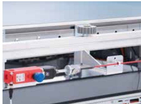
Ausrüstung für CE Konformität: Reißleine längs zum Rückführband